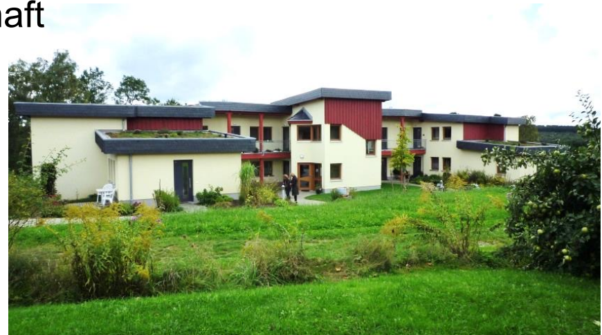
Blick auf den Altersgarten