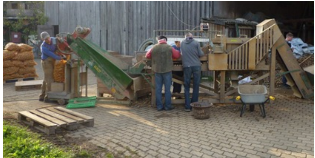
Gemeinschaftliches Sortieren von Kartoffeln